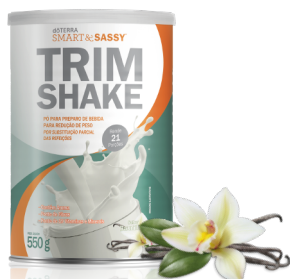
dōTERRA SMART & SASSY® TRIMSHAKE BAUNILHA PÓ PARA PREPARO DE BEBIDA