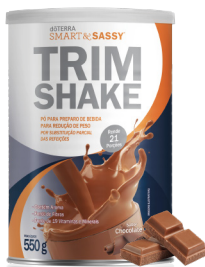
dōTERRA SMART & SASSY® TRIMSHAKE CHOCOLATE PÓ PARA PREPARO DE BEBIDA